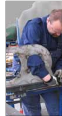
Spannen des Troges