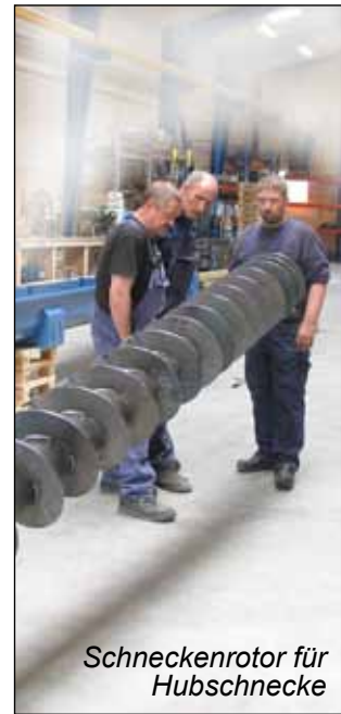
Schneckenrotor für Hubschnecke

Verteiler System bestehend aus zwei Schneckens und Empfangspuffer. Komplett Lieferung inkl. Klappe, Unterstützung und Engineering/Konstruktion.