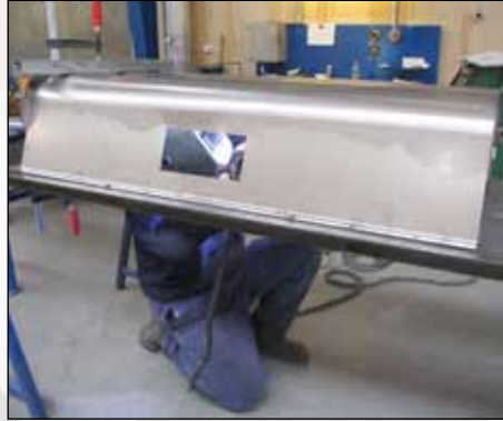
Schweißen von Doppel Schneckenrotor