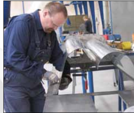
Sammlung die Trog teile bis zum fertigen Haus