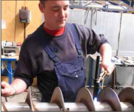
Richten von rostfreiem Schneckenrotor